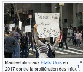
Manifestation aux États-Unis en 2017 contre la prolifération des infox 1 .

Les infox revendiquées par des instances officielles, comme les autorités ukrainiennes en mai 2018 posent la question de la crédibilité de l'information 10, 11 et des médias qui la diffusent.